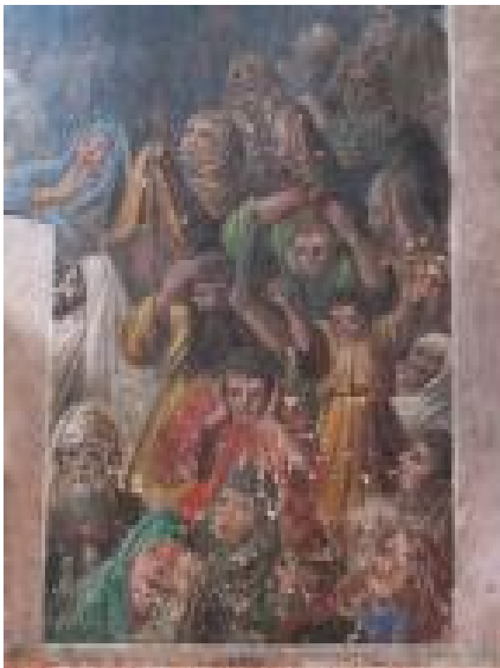
Страшный суд. Стенопись храма в с. Уланок (фрагмент, правая часть росписи)