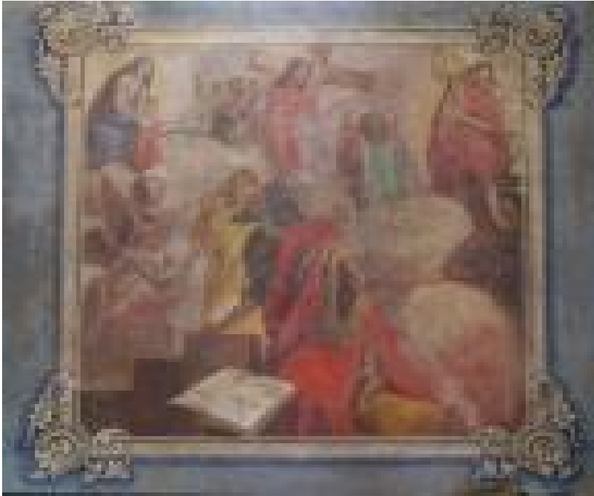
Видение пророка Исайи. Стенопись храма (с. Уланок)

исследователи церковного искусства Слобожанщины. Даже после археологического съезда в Харькове, в 1902 г., когда интерес к церковному искусству Слободской Украины возрос, исследователи продолжали обходить этот феномен стороной.