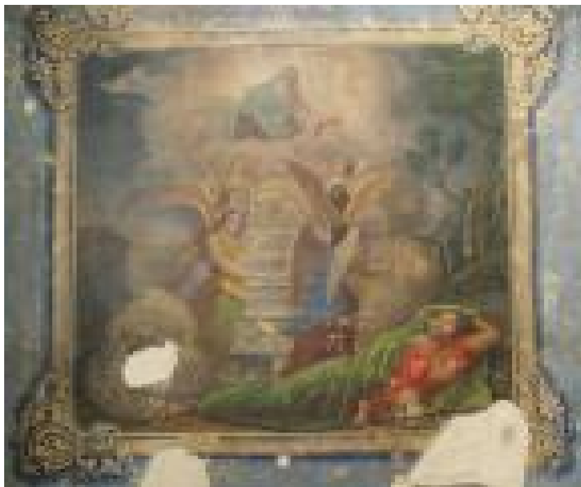
Лествиця Іакова. Стенопись храма (с. Уланок).