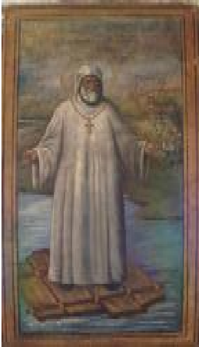
Св. Афанасий Великий. Стенопись храма (с. Борки, Курская обл.)

они близки Борковским росписям, как по технико-технологическим, так и по стилистическим характеристиками. К подобному типу решения стенописей также относятся храмы: Трехсвятительский храм г. Харьков (1915 г.), Свято-Благовещенский собор г. Харьков (после 1901 г.), Свято-Озерянский храм Свято-Покровского монастыря г. Харьков.