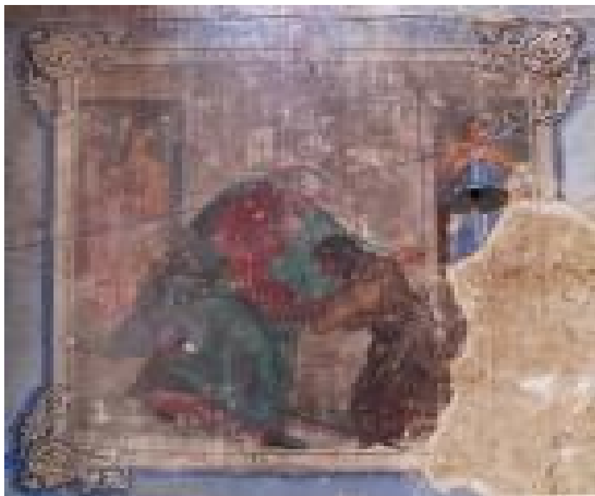
Притча о блудном сыне. Стенопись храма (с. Уланок)

стенописи Свято-Ильинского храма в с. Заолешинке (Суджанский район Курской обл.), где на сводах шатрового купола помещены изображения праздников: Воскресение Христово, Вознесение, Преображение Господне и Успение Пресвятой Богородицы. Эти четыре композиции повторяют росписи парусов храма Христа Спасителя в Москве. Несмотря на иные конструктивные особенности храма, росписи которого послужили образцом, и храма в котором была повторена иконографическая программа росписей, автор Заолешинских стенописей свободно их размещает нечего ни меняя в композиции. Купол храма, незначительный по размеру, так же ориентирован на московский образец. В нем изображен Господь Саваоф. На западной стене помещено изображение страшного суда, которое повторяет роспись собора св. Владимира в Киеве.