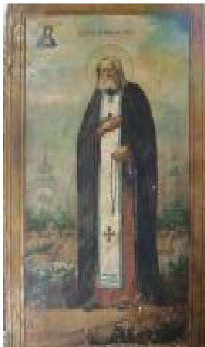
Прп. Серафим Саровский. Стенопись храма (с. Борки, Курская обл.)

(надписание «Спаситель в терновом венце»); 2. Явление Христа Марии Магдалине; 3. Св. прп. Феодора; 4. Св. великомуч. Варвара; 5. Св. апл. Петр и Павел; 6. Св. великомуч. Екатерина; 7. Св. прор. Анна; 8. Св. священомуч. Власий; 9. Св. великомуч. Никита арх. Новгородский и Св. муч. (?); 10. Усекновение главы Иоанна Предтечи; 11. Св. Анастасия; 12. Прп. Серафим Саровский. 13. Св. Афанасий Александрийский; 14. Св. муч. Марина и др. Святыя изображены на фоне низкого горизонта, с растительностью в виде пальм, кипарисов и т.д. Купол расписан в виде звездного неба. В парусах изображены Евангелисты.