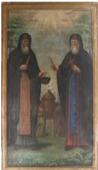
Прп. Зосима и Савватий. Стенопись храма (с. Борки, Курская обл.)