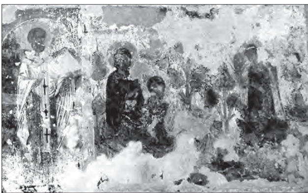
Іл. 12. Христос Недріманне Око. Церква св. Онуфрія в Посаді Риботицьких (Польща) кін. XV — поч. XVI ст.

ської. Коли євреї прийшли в пустелю Фаран, Господь велів Мойсею послати 12 чол., по одному з кожного коліна Ізраїлевого, соглядатаями у землю обітовану, аби переконатись у її багатстві та родю-