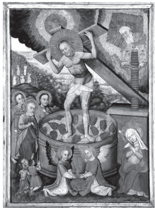
Іл. 9. Христос у точилі. Кін. XVII ст. с. Мотижин, Київщина. Національний художній музей України

Сюжет ікони побудовано на біблійній розповіді про подорож ізраїльтян з Єгипту до землі Ханаан-