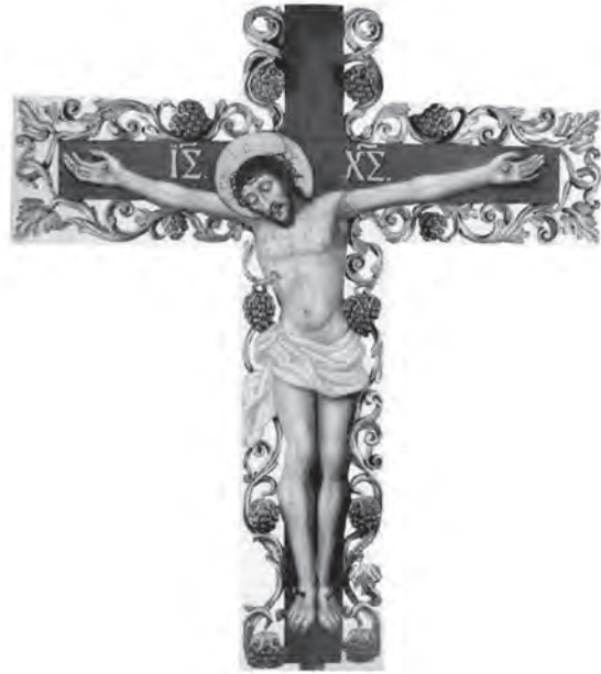
Іл. 13. Розп'яття з виноградною лозою. Церква Воздвиження Чесного Хреста із Скиту Манявського (1698—1705). Йов Кондзелевич

В українському мистецтві композицію «Недріманного Ока» збагатили новими деталями: на тлі міг бути