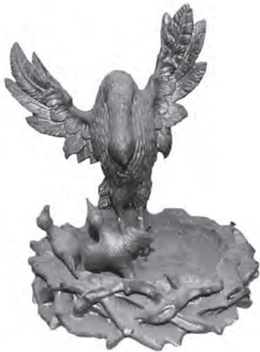
Іл. 14. «Пелікан». Дерев'яна пластика, XVII — поч. XVIII ст.; збірка монахів студитів

У візантійському мистецтві такі образи присутні тільки в пізню добу, наприклад, в атенському монастирі апостола Павла. У Західній Європі, навпаки, вони були розповсюджені, починаючи з XVIII ст. Але все-таки там ця композиція не мала того поширення, як на землях України. На Заході вона обмежується тільки образом пелікана з пташенятами, а іноді і самим пеліканом, а на українських землях образ ускладнюють ще й знаряддя тортур Христових — хрест, спис, тростина з губкою, серце з полум'ям, інколи із серця стікає кров у чашу, або зображали окремо чашу й серце, Адамову голову, змія. З приводу останнього, то відома притча про боротьбу пелікана із змієм, що символізує боротьбу Христа з дияволом. Образ пелікана присутній на саккосах, панагіях, дарохранильницях, а також як прикраса на меблях та килимах. Окрім іншого, цей символ інколи був у композиції Страшного Суду, Розп'яття, в іконі Божої Матері, а також самостійно [41]. Варіант такого сюжету в українській іконографії представлений роботою невідомого майстра з Наддніпрянщини, початку XIX ст.; зберігається у Національному художньому музеї України. Побутовув сюжет «Пелікана» і у дерев'яній пластичі, про що засвідчує робота XVII — поч. XVIII ст. (іл. 14); знаходиться у збірці монахів студитів.