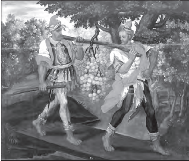
Іл. 10. Соглядатаї землі Ханаанської. 1730 р. с. Сулімівці, Полтавщина, (Київська обл.). Національний художній музей України