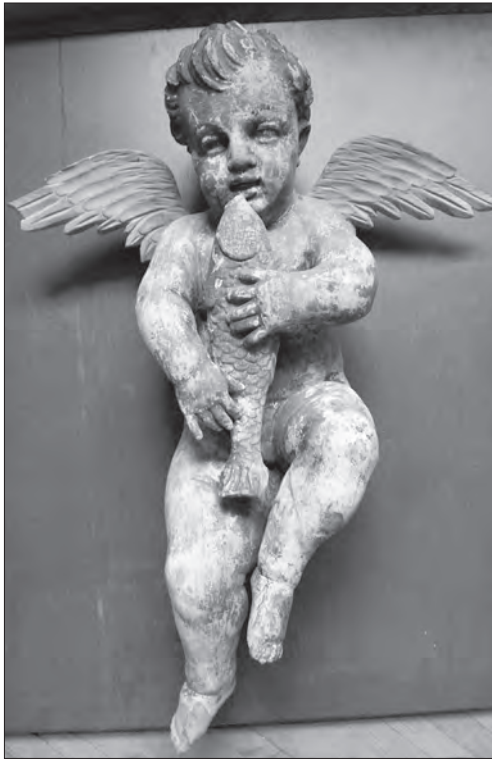
Іл. 1. Ангел. Зі с. Верен, Миколаївського р-ну (1—1375). Публікується вперше

з вираженим євхаристійним значенням. Євхаристійне значення риби пов'язується з просвітними євангельськими трапезами: наситити народ у пустелі хлібами і рибами (Мт 6:34—44) трапезою Христа й апостолів на Тіверіадському озері після Неділі (Ін 21:9—22), сюжет якої часто зображався у катакомбних церквах поряд із Тайною вечерею. Символ риби ототожнювався із самим Христом.