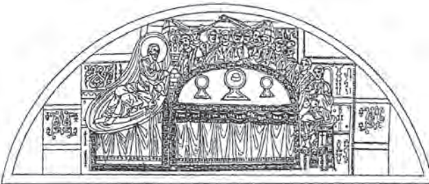
Іл. 4. Тайна вечеря. XI ст., фреска Собору Софії Київської

в Україні важливим джерелом алегоричної іконографії був виданий Києво-Печерською друкарнею у 1712 р. філософсько-моралістичний твір «Ифика ієрополитика, или философия нравоучительная символами и приудоблениями изъяснена к наставлению и пользы юным», в якому наявна гравюра із зображенням Бахуса, поряд з яким на бочці зображено евхаристійну композицію Жертвоприношення Авраама [12]. Отже, філософські та релігійні ідеї того часу знайшли свій вираз у різних алегоріях. На думку українського мистецтвознавця Павла Жолтовського, українські художники вклали цілу систему суспільних, філософських, моральних і релігійних поглядів в оболонку алегоричних зображень, що становили основу культури їхньої доби [13].