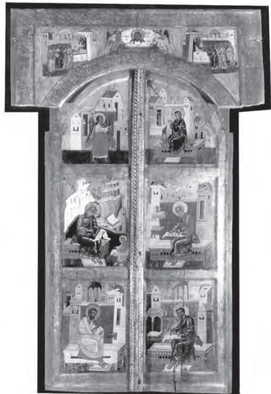
Іл. 5. Царські врата. Зі с. Клеців Сарненського р-ну. XVI ст. Історико-краєзнавчий музей, Рівне