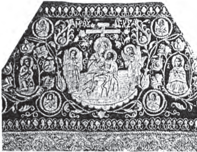
Іл. 8. Фелон (фрагмент). Оксамит, срібні нитки, обличчя мальовані. 1773 р. (КПЛ-47)

Євхаристійна тематика у XVII—XVIII ст. знайшла відображення і в одному з видів декоративного мистецтва України — літургійному гаптуванні, в якому чільне місце посідає тема Страстей. Проте в шитві Євхаристійна тема не набула послідовного розвитку. Увагу привертає цікава іконографічна композиція Євхаристійного змісту: це поодинока пам'ятка, що не має ні попередніх, ні подальших зображень в українському гаптуванні — фелон 1773 р. (іл. 8) (КПЛ-47). В оточенні гнучкого барокового орнаменту вишита сцена «Пієта». Богородиця тримає на колінах дорослого Христа, обабіч — ангели із знаряддями мучеництва. На перший погляд, перед нами сцена «Пієта», але майстриня зображує Христа з потиром в який стікає кров, а всю сцену вміщено в круглу таріль. Це надає їй євхаристійного відтінку і саме цією символічно-богословською ідеєю можна пояснити те, що