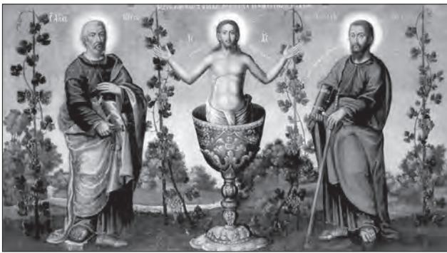
Іл. 11. Христос у чаші. Київський майстер середини XVIII ст. Національний художній музей України