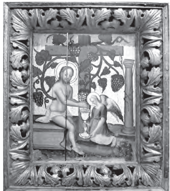
Іл. 7. Спас-Виноградар, с. Полонична, Львівська обл. НМЛ, І-866, Кв-30676. 1741 р.