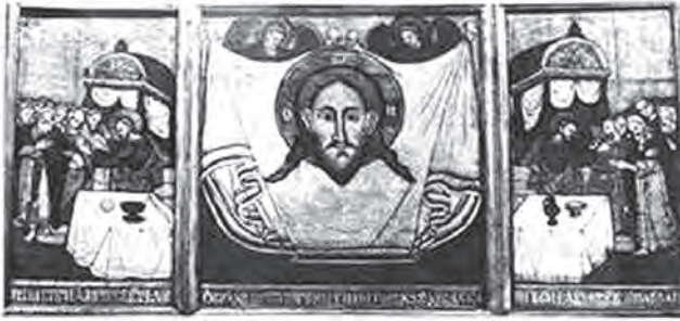
Іл. 6. Волинська ікона Спас Нерукотворний зі сценою Причастя апостолів, 1621 р. Художній музей Харкова

коїться на платі, прикрашеному бахромою з обох боків. Середню частину його мертвого тіла закриває літургійний покров. Значення євхаристії зображення розкриває напис, виконаний над ним: «Ядущий Мою Плоть і пиющий Мою Кров перебуває в Мені і Я в ній» (Ін. 6, 56) [18]. Плащаниця, представлена на цій фресці, відразу викликає у пам'яті образ Нерукотворного Спаса, що, в принципі, не дивно, позаяк обидва плати однаково пов'язані зі страстями і Воскресінням Спасителя. Щодо Нерукотворного Спаса, то розміщення його у вітварі храму відображає розуміння образу, як жертви євхаристії.