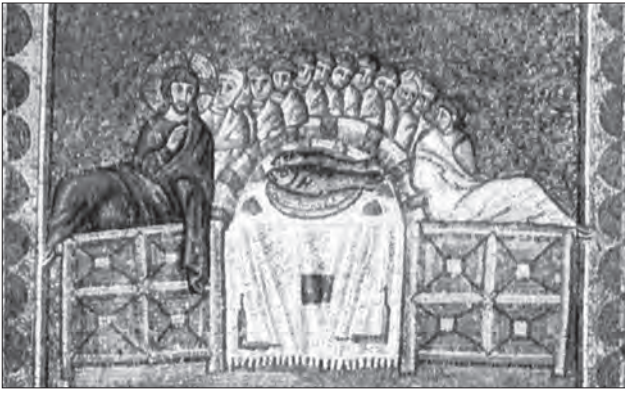
Іл. 3. Тайна вечеря. VI ст. Мозаїка Сан Аполінаре Нуово