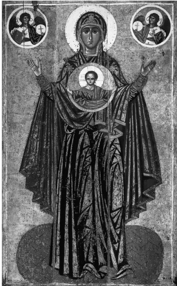
1. Богородиця — Велика Панагія (Ярославська Оранта). Початок XII ст. ДТГ.

живописний ансамбль дає широку палітру манер художників, або навіть різних шкіл. До робіт по оздобленню храму, крім греків, могли бути залучені також місцеві, київські майстри [17, с. 90] і, що не виключено, з відомої майстерні Печерського монастиря, де на той час працював майстер Аліпій, який мав відповідний досвід праці в монументальному малярстві. Певні елементи пропорційної побудови фігури з Михайлівських фресок — маємо на увазі маленькі ручки та ніжки у фігурі Захарія — знаходять відображення у відповідних частинах тіла «Ярославської Оранти» [26, с. 15], а окремі риси в зображенні очей Богородиці й мозаїчних Дмитрія Солунського та архidiaкона Стефана — усі вони