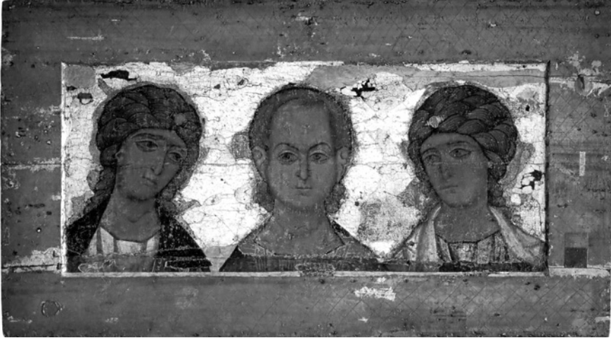
2. Деїсус: Архангел Михаїл, Спас Емануїл, Архангел Гавріїл. Середина XII ст. ДТГ

городиці «Знамення» або «Втілення», що підтверджується численними печатками церковних ієрархів [34, с. 52], а пізніше з відновленням Київської митрополії у 1620 р. цей образ використовувався на печатках митрополитом Йовом Борецьким (1620–1631) [34, с. 169], як продовження стародавньої київської традиції. Про розповсюдженість цього іконографічного ізводу на теренах Києва промовляє також і різьблення кам'яної двобічної іконки-підвіски з Богоматір'ю «Втілення» (Велика Панагія) та св. Стефана першої половини XII ст. [13, с. 95], що була знайдена біля Михайлівського Золотоверхого монастиря, та образ Богоматері «Знамення» зі срібного медальйона XII ст. з колекції НМІУ [27, с. 39].